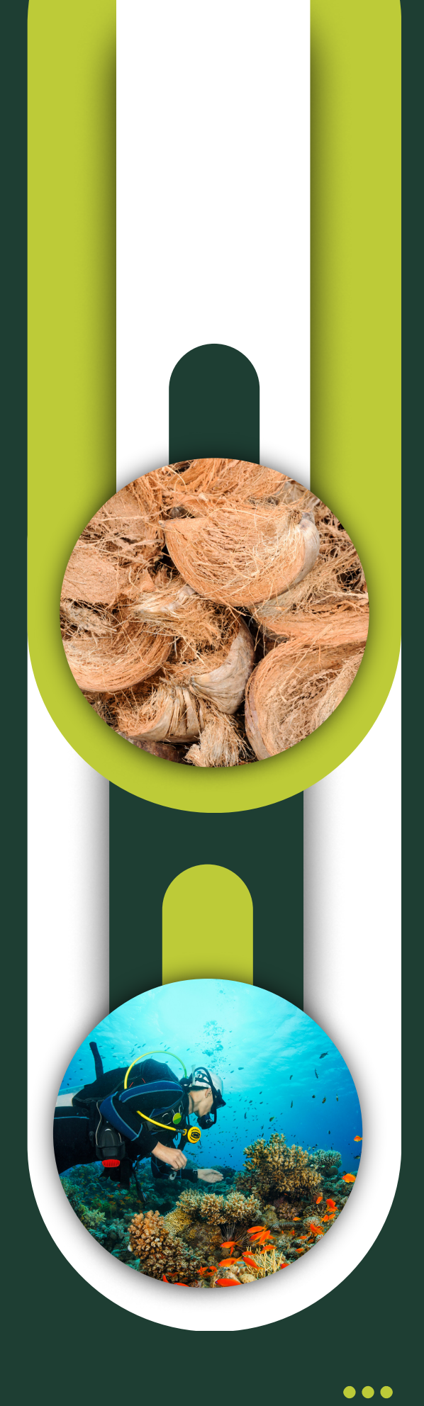
Table Of Content About Us Vision And Misson Our Services Our Team Contact Information