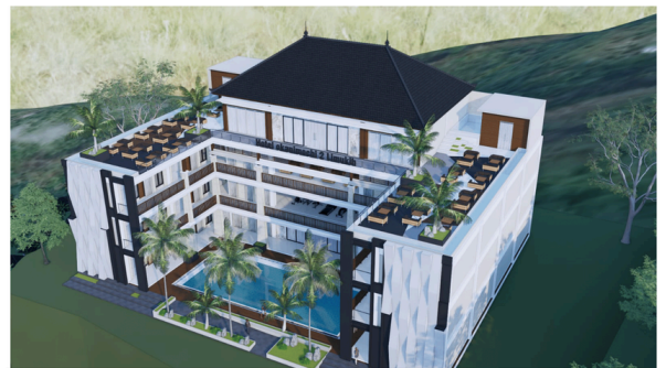
TAMPAK MATA BURUNG

For More Information Regarding Development Sketches Please Contact US